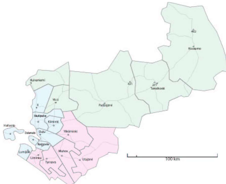
Kuva 2. Oulu/Koillismaa-alueen solujako.

Oulu/Koillismaan pelastuspalvelualue päätettiin jakaa kolmeen soluun kuntien suhteellisen vähäisen määrän sekä pitkien välimatkojen vuoksi. Solujako on kuvattu kuvassa 2.